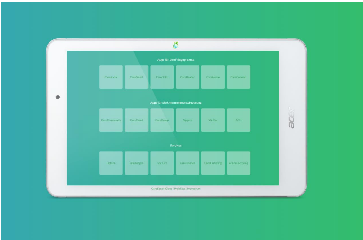
Abb.: Komplette Unternehmenssteuerung in der Pflege auf dem Tablet

Ihre Pflegeeinrichtung komplett mobil steuern – jederzeit, an jedem Ort?