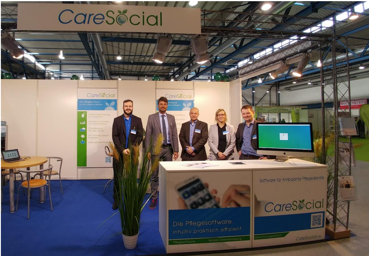
Abb.: Das Messteam vor Ort auf der 1. Pflegemesse Cottbus

Vom 04.03. bis zum 05.03.2017 fand die erste Pflegemesse in Cottbus statt. Auf der regionalen Messe in Brandenburg haben wir ein spannendes Wochenende verbracht und möchten uns an dieser Stelle nochmal herzlich dafür bedanken, dass so viele Bestandskunden sich auf den Weg gemacht und uns vor Ort begrüßt haben. Das Feedback unsererseits zur Messe ist durchweg positiv und wir freuen uns, im nächsten Jahr wieder dabei zu sein.